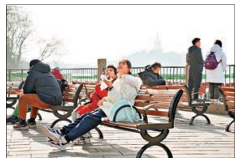
民眾外出享受冬日暖陽。

近期以來，新冠病毒變異株JN.1引發各界關注。王大燕表示，近期，多渠道監測系統數據顯示，元旦假期後，內地新冠疫情仍處於較低水平，其中哨點醫院新冠病毒檢測陽性率保持在1%以下，JN.1變異株佔比呈現上升趨勢。專家研判認為，今冬明春內地將繼續呈現多種呼吸道病原交替或者共同流行態勢，短期內仍將以流感病毒為主。受JN.1變異株持續輸入、國內流感活動逐漸降低和人群免疫水平下降等多因素影響，新冠病毒感染疫情可能在本月出現回升，JN.1變異株大概率將發展成為優勢流行株。