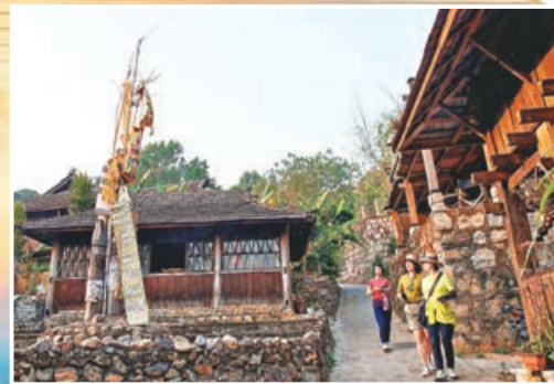
■景邁山旅遊產業隨着申遺成功也逐漸熱起來。