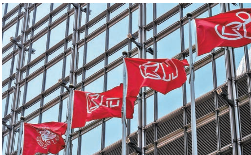
■ 公用股續獲市場關注。長建及電能均逆市走高。

港股在16,000點至16,400點區間徘徊，但要提防短期波幅有機會再次擴大。指數股各自發展，其中，防禦性較強的公用股，繼續獲投資者關注，長江