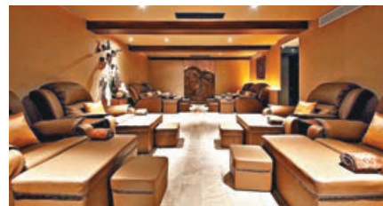
「足府」內部裝修豪華。