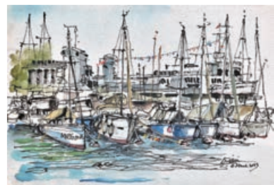
■岑延威 《銅鑼灣海傍遊艇會》

是次展覽展出逾百幅水彩畫及攝影作品，分別以「山」、「水」、「建築」和「城市」四大面向為切入點，勾勒香港的自然景致、建築和文化，包括：不同描繪風格下的遊艇、充滿地區色彩的北角、香港的經典電車、維港今昔、傳統的水上天后廟、活化的美利樓，以及中環交錯競爭中的商廈等等，以集體回憶代代傳承我們的文化。