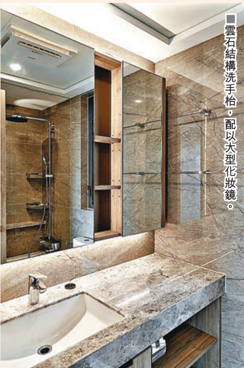
■雲石結構洗手枱，配以大型化妝鏡。