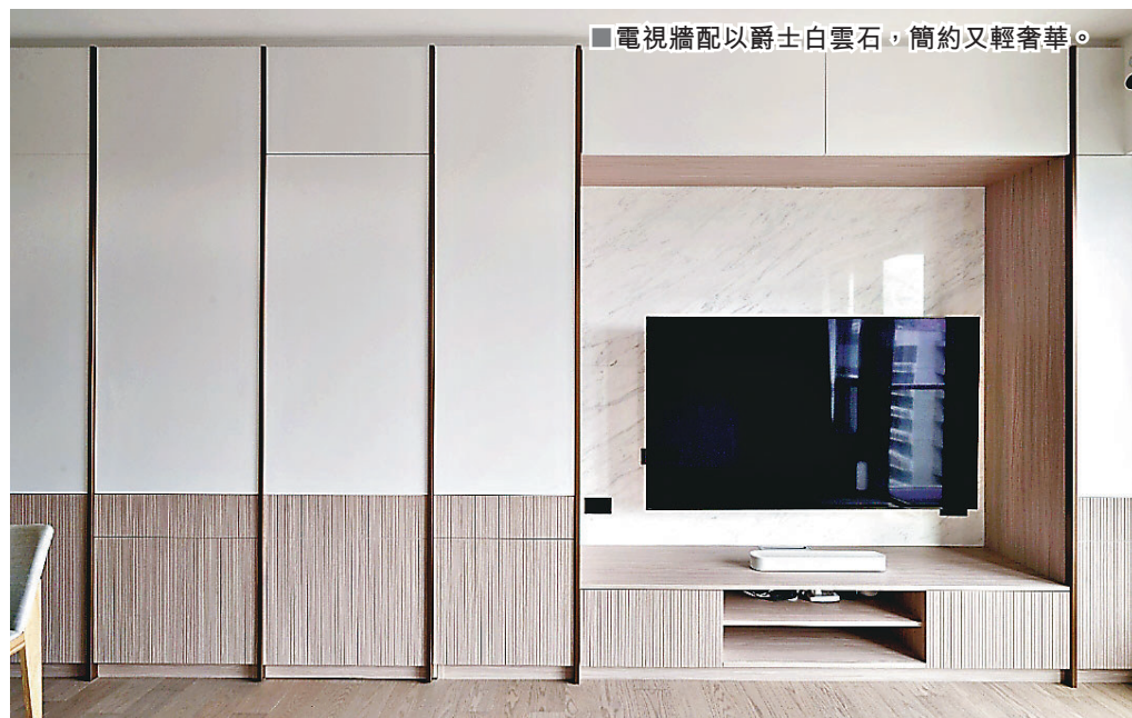
■電視牆配以爵士白雲石，簡約又輕奢華。

Kenji 解釋，所謂輕奢風，非追求浮誇外露的虛榮感，而是在低調中選擇適當的物料或裝飾襯托。簡單卻不缺質感，純粹卻不乏氣質，才能達至輕奢華感覺。