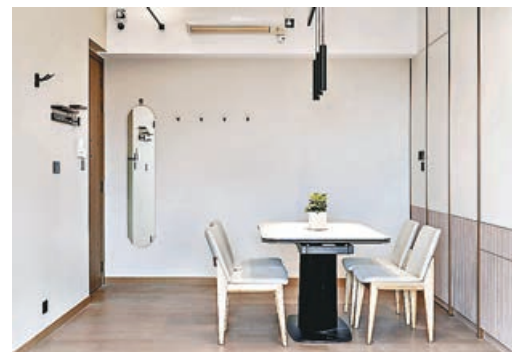
■飯廳一角，牆壁懸掛的鏡子別具特色。