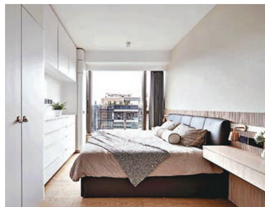
■主人房與大廳格調一致，同樣是白色與啡色條紋的配搭。