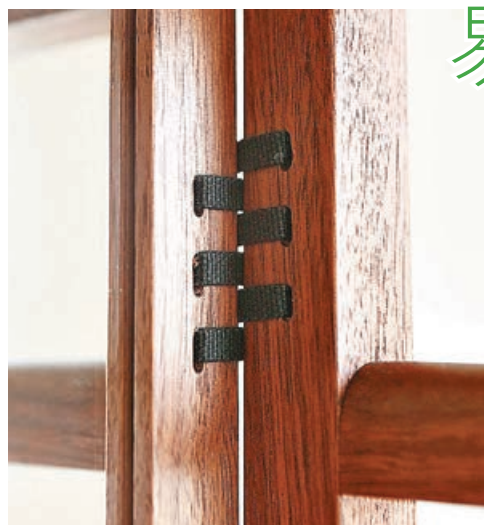
■衣架以繩結技術省去常見的金屬配件。

SPAGO 於意大利語中，意思為繩結，而繩結的傢具設計早於日本的傳統摺疊屏風可以看到。來自日本福岡的傢俬品牌 HIRASHIMA 將這種傳統繩結設計，套用於 SPAGO 系列。