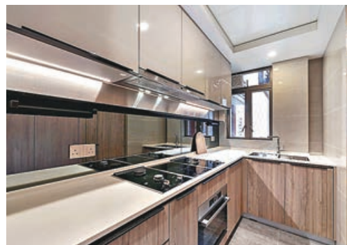
■長長的煮食枱，實用又美觀。