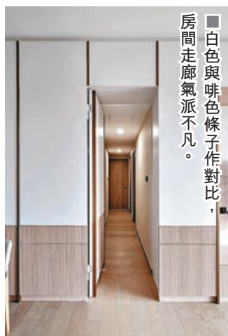
■白色與啡色條子作對比，房間走廊氣派不凡。