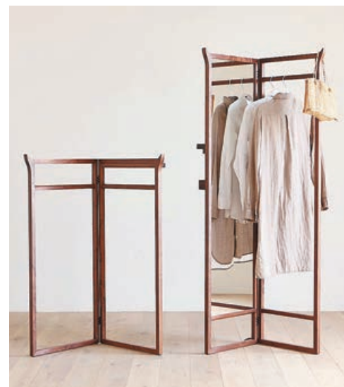
■衣帽架有兩種尺碼選擇。

當中的 SPAGO Hanger Rack 掛架，使用了這種繩結技術，省去常見的金屬配件，整體效果更優雅細緻。而且成為 SPAGO Hanger 的獨特設計，提升了