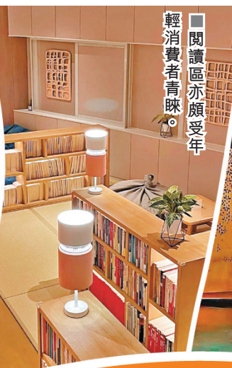
■閱讀區亦頗受年輕消費者青睞。