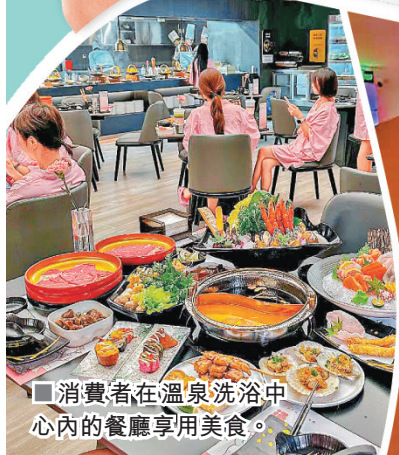
■消費者在溫泉洗浴中心內的餐廳享用美食。

從業者看來，內地溫泉洗浴行業仍有廣闊發展空間。有業內人士表示，自己未來打算與膠囊酒店等形式結合，擴大在住宿方面的服務類型。張凌偉則表示，未來一方面想在節能上發力，如將客人泡澡使用的廢水收集起來循環再利用，另一方面則考慮將老年人康養與溫泉產業結合，通過藥浴、理療、汗蒸等，打造新型的溫泉養老公寓。