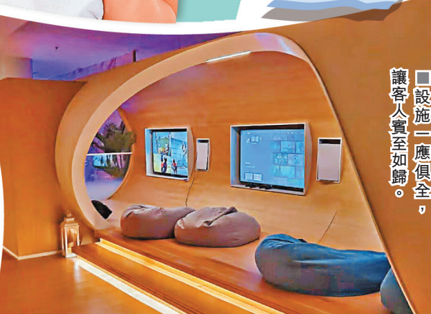
■設施一應俱全，讓客人賓至如歸。