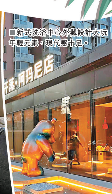
■新式洗浴中心外觀設計大玩年輕元素，現代感十足。