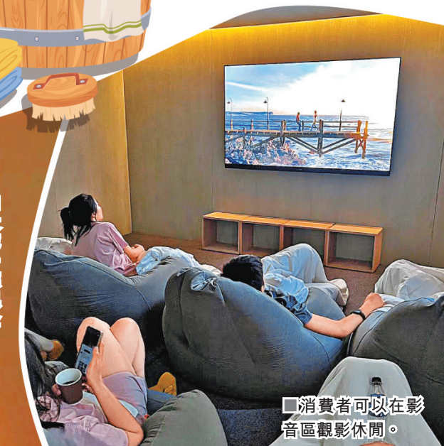
■消費者可以在影音區觀影休閒。