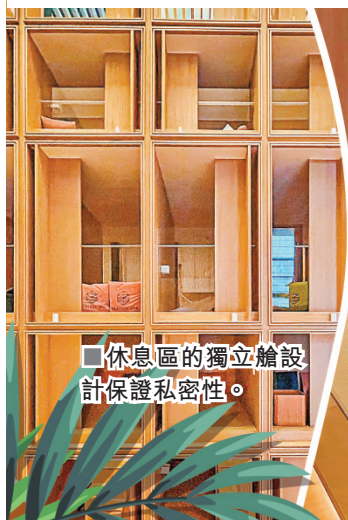
■休息區的獨立艙設計保證私密性。