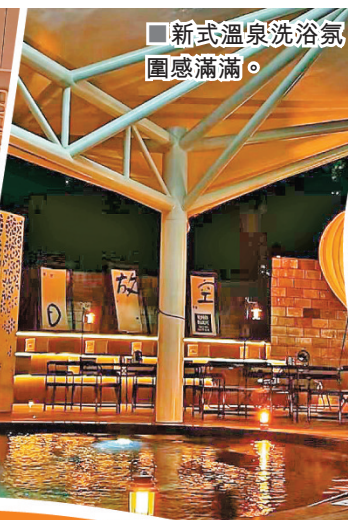
■新式溫泉洗浴氛圍感滿滿。