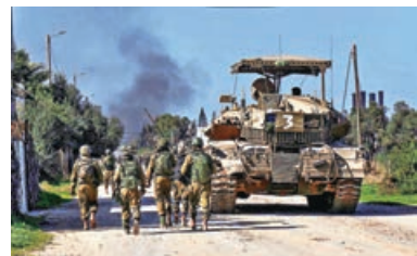
有傳哈以兩週內可望停火。圖為以軍在加沙街頭進行軍事行動。

據《紐約時報》報道，以色列和哈馬斯就加沙停火及釋放人質的談判接近達成協議，雙方將停火兩個月，換取逾100名以色列人質獲釋及更多人道物資運入加沙。