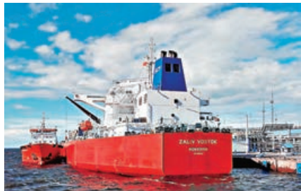
俄羅斯出口石油，大多數由英國公司作承保。

據今日俄羅斯電視台（RT）網站和部分英國媒體報道，芬蘭「能源與清潔空氣研究中心」（CREA）近日在報告中表示，自俄烏衝突爆發以來，