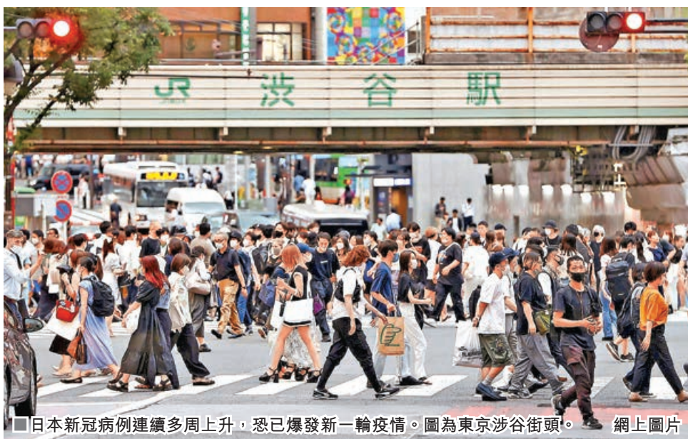
日本新冠病例連續多周上升，恐已爆發新一輪疫情。圖為東京涉谷街頭。

疫情升溫的背後原因，相信是海外在去年秋天起快速擴散的新變異株JN.1，也在日本境內蔓延。世界衛生組織表示，目前沒有JN.1較其他變異株更容易造成重症的報告。不過根據世衛及日本東京大學醫學研究所等發布的內容，因為變異提高了免疫逃脫能力，恐將更易造成疫情擴散。