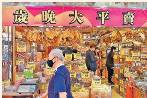
■臨近歲晚，商戶最怕收到偽鈔。 資料圖片