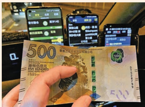
■早前有的士司機展示收到乘客支付的懷疑500元偽鈔。

甲辰龍年快到，但每逢歲晚，總有一些偽鈔流出，近期就有涼茶舖、的士司機以至士多先後收到俗稱「大牛」的500元偽鈔！有見及此，本報特此整理香港金管局辨別偽鈔招數，讓大家提高警覺，避免中招！