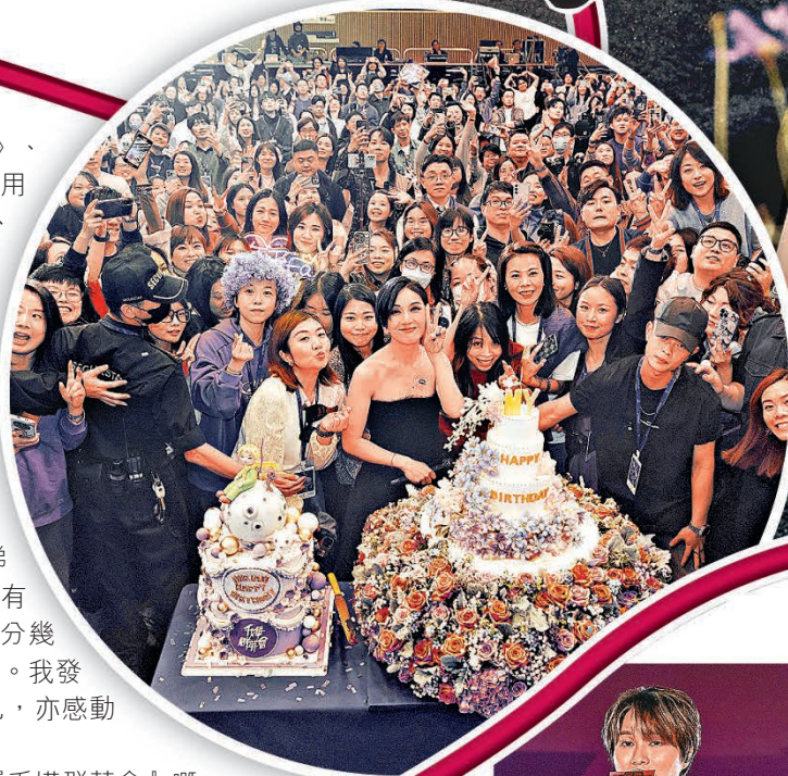
■千嬅堅強面對逆境。

千嬅寄語大家愛錫自己，遇上難關時要提升自己的能量：「呢個係『千嬅群英會』嘅精神，我50歲都做到，你哋咁後生，可以活得更精彩……大家聽住我嘅歌，就可以似我保養得咁好。」全場歡呼拍掌，不過千嬅笑言：「我唔係話保養個樣，係話個腦呀。」笑爆全場。活動完結，歌迷仍不願離去嗌Encore，千嬅跑出來說：「真係唔可以留喇，個場10點門門，我生日剩番兩個鐘，你哋畀我同屋企人、朋友過啦。」歌迷才不捨離開。