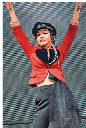
■中島美嘉首次在香港開騷。

日本歌姬中島美嘉出道廿載，前晚首次在香港亞博舉行演唱會，以《AMAZING GRACE》為個唱揭開序幕。當她唱《GLAMOROUS SKY》時，特意穿上當年在電影《Nana》穿過的紅色外套及帽，原來這套服飾她多年來沒再公開穿過，今次特別為香港演出而重現經典造型，為香港樂迷送上驚喜。她還唱出大熱歌曲《雪之華》、《曾經我也想過一了百了》、《Mission》等，與港迷共度歡愉的一晚。