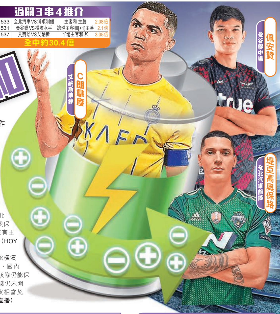
C朗拿度 艾納斯前鋒