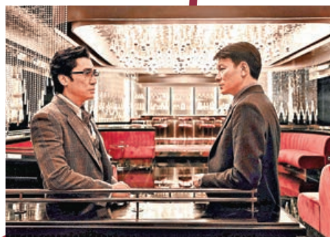
偉仔(左)與劉德華於《金手指》的演技備受讚賞。