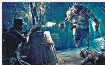
《遺蹟2》是一款魂系兼刷寶射擊遊戲。