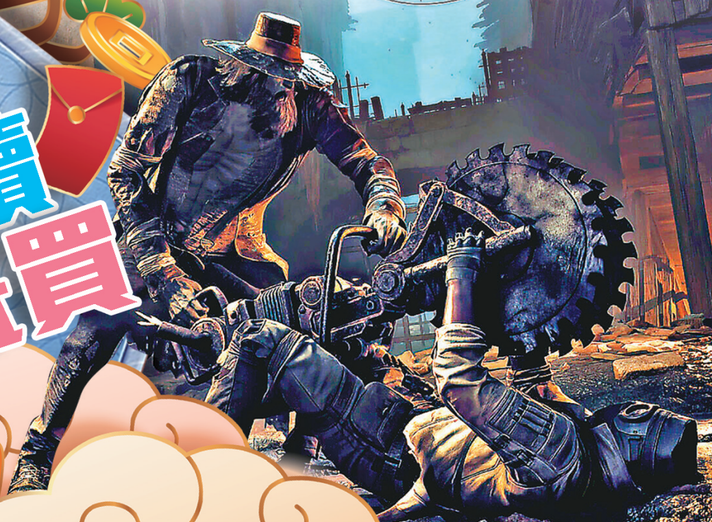
玩家可以與好友組隊，一起對抗邪惡生物。