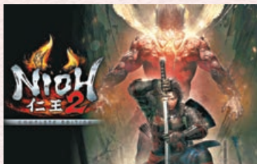
《仁王2》以高難度著稱。