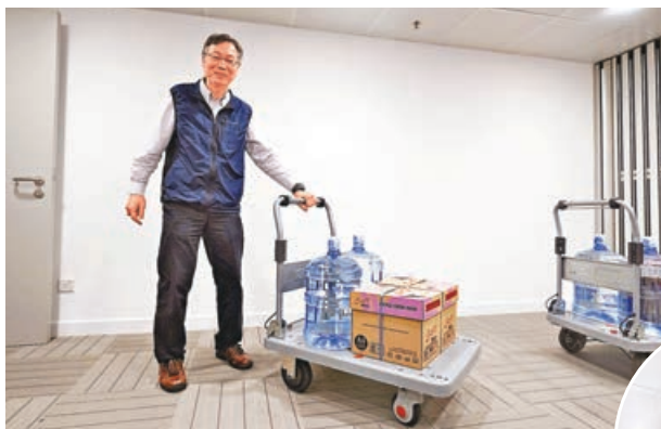
■ 物流及供應鏈多元技術研發中心(LSCM)研發的電動手推車系統。