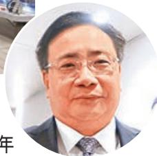
■ 創新科技署署長李國彬

香港正致力發展成為國際創新科技中心，特區政府創新科技署署長李國彬日前回顧去年工作時指，署方管理的「創新及科技基金」於去年首11個月核准約2萬項申請，批出多達67億元承擔額，全方位支持香港創科發展。展望未來，他透露將於今年內成立香港微電子研發院，引領及促進大學、研發中心和業界合作，研發第三代半導體核心技術，並將開展籌備建設第三個「InnoHK」研發平台的工作，聚焦先進製造、材料、能源及可持續發展。