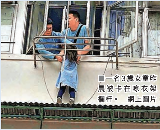
一名3歲女童昨晨被卡在晾衣架欄杆。

深水埗一名年僅3歲女童，昨疑被外出買餸的母親獨留在家，期間女童攀窗往外張望時失足，跌出4樓窗外，身體卡在晾衣架的兩條欄杆之間動彈不得，驚險萬分。幸有兩名街坊及時發現，立即報警及衝上單位合力將女童拉入屋。警員及消防員其後趕抵證實女童安全無表面傷勢，由趕回家的父親陪同送往明愛醫院檢查。女童母親則涉嫌「對所看管兒童或少年人虐待或忽略」被捕，案件由深水埗警區刑事調查隊第八隊跟進。