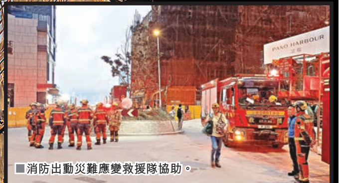
消防出動災難應變救援隊協助。