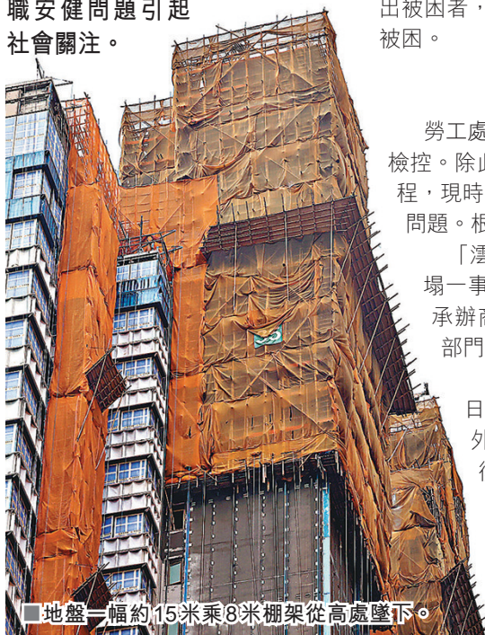
地盤一幅約15米乘8米棚架從高處墜下。