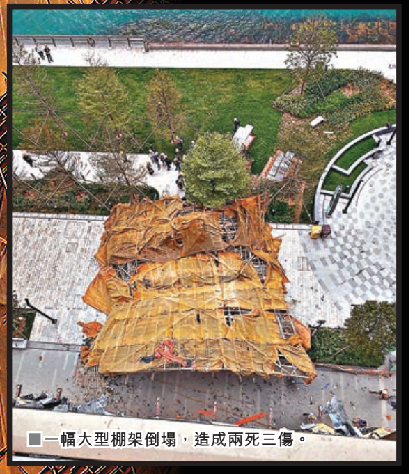
一幅大型棚架倒塌，造成兩死三傷。