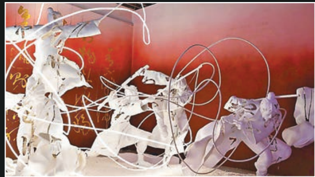
■燈光藝術裝置「劍舞」呈現人們對酒劍詩仙的浪漫想像。