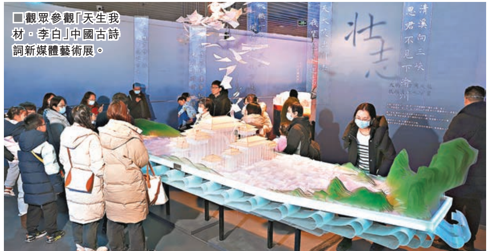
■觀眾參觀「天生我材·李白」中國古詩詞新媒體藝術展。

身為「大唐第一偶像」，李白一生創作詩歌近千首，在詩歌的每一條賽道上都留下了獨特的烙印。「天生我材·李白」是中國古詩詞新媒體藝術系列展首展，運用新媒體藝術化的表現形式，探索李白詩作的大千世界，多維度展現李白生命歷程的不同特點。觀眾們可以帶着疑問與謫仙人同道，再讀那些精妙絕倫的詩句，在展覽間探尋這位天縱之才斗酒百篇的秘密。據悉，該展覽持續至2月29日。