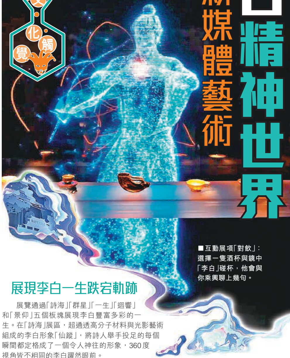
■互動展項「對飲」：選擇一隻酒杯與鏡中「李白」碰杯，他會與你乘興聊上幾句。