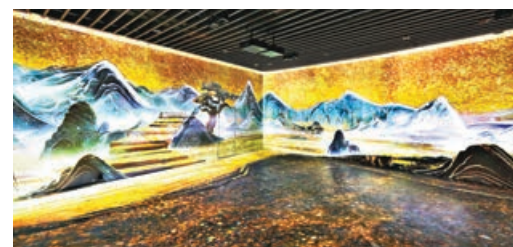
■展覽四周遍布LED屏幕，通過光影變幻，展示詩歌鼎盛的盛唐時期。