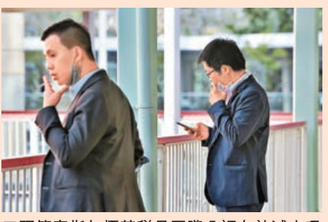
預算案指加煙草稅是國際公認有效減少吸煙的措施。

特區政府近年致力採取各項措施加強控煙成效，財政司司長陳茂波昨宣讀新一份財政預算案時表示，增加煙草稅是國際公認最有效減低煙草使用的措施，因此建議即時將每支煙的稅款調高0.8元，並按同等比例提高其他煙草產品的稅率，升幅與去年相若。他預期煙草稅佔香煙零售價比例將提升至約70%，逐步邁向世界衛生組織建議的75%水平，可加強戒煙誘因，保障公眾健康。特區政府亦會繼續大力打擊私煙，加強戒煙服務以及宣傳教育。今次是政府連續第二年增加煙稅，去年每支煙的稅款上調0.6元，加幅31.48%，今年加幅則為31.92%。政府消息人士指出，以市面常見一包香煙20支計算，去年加稅後每包香煙稅款為50.12元，平均零售價77.69元，煙草稅佔香煙零售價的比例約為65%。今次加煙稅後，每包香煙的稅款為66.12元，估計平均零售價為93.68元，當中71%為稅款。有便利店在預算案公布加煙稅措施後，即時在收銀處附近貼出告示調整香煙價格，20支包裝香煙加價16元，25支包裝則加20元。