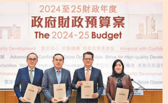
陳茂波(右二)昨發表新一份財政預算案。

香港既無資本增值稅，亦無銷售稅，不擔心設立薪俸稅兩級制會影響人才來港意慾。陳茂波又宣布，今年上半年度就住宅物業累進差餉制度提出法例修訂，目標於2024至25年度第四季(即2025年第一季)生效。新制度只影響應課差餉租值逾55萬元的住宅物業，差餉租值55萬元或以以下住宅物業，一如現時按差餉租值5%徵收。屆時差餉租值超過55萬元的住宅，首55萬元差餉租值同樣按5%徵收，其後25萬元差餉租值則按8%徵收，超出80萬元的差餉租值部分將按12%徵收，預計在新制度下，政府每年收入約增加8.4億元。