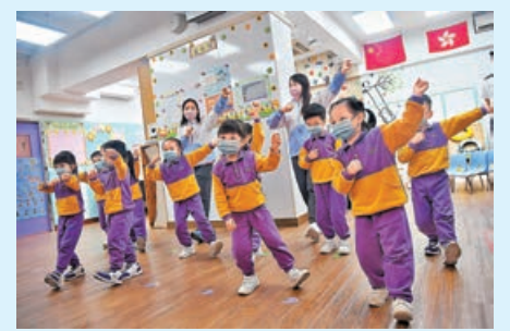
政府今年起分階段增設10所資助獨立幼兒中心。

財政司司長陳茂波昨宣讀財政預算案，提到今年內會檢討「2元乘車優惠」及「公共交通費用補貼計劃」，指兩項計劃財政開支均較2019/20年倍增，其中