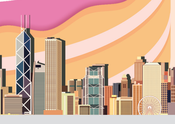
政府增加對高收入人士徵稅。