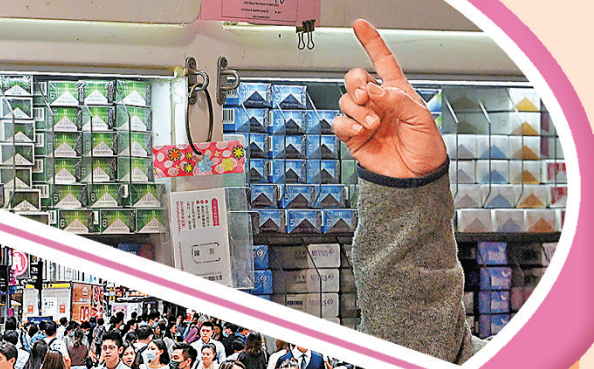
預算案建議即時將每支煙稅款調高0.8元，平均每包煙加價16元。

政府2022年已將擬議制度詳情和實施時間表提交立法會財經事務委員會討論，獲委員普遍支持。政府指約4.2萬個住宅物業按累進制徵收差餉(包括獨立評估差餉的住宅單位)，佔所有私人住宅單位約1.9%，當中包括約1.8萬個差餉租值逾80萬元單位，其餘98%即約216萬個單位不受影響。須繳累進差餉住宅物業的繳納人今年4月會獲通知，而明年1月至3月季度起的徵收差餉或地租通知書，會顯示計算該季度適用的應繳累進差餉款額。另外，「冰封」近30年的商業登記費，將於4月起由每年2,000元上調10%至2,200元，料每年收入增約2.95億元。