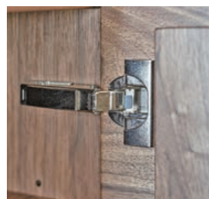
■鞋櫃的金屬門鉸採用奧地利名牌 Blum。

實木鞋櫃最底一層特意做了鏤空的設計，方便客人清潔之外，也方便把鞋子放在下方，晾乾後才擺進鞋櫃內。背部也為香港客人設了避地腳線的部分，展現日本設計的細心。