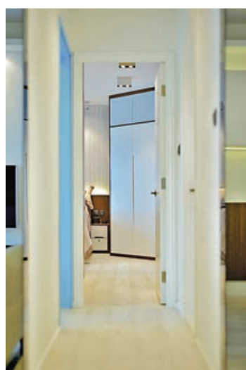
■房間走廊地板和房間統一以淺色布置作主調。