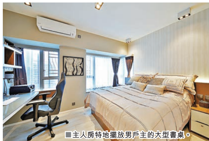
■主人房特地擺放男屋主的大型書桌。