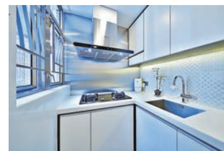
■廚房採用7字形煮食枱，收納櫃充足。