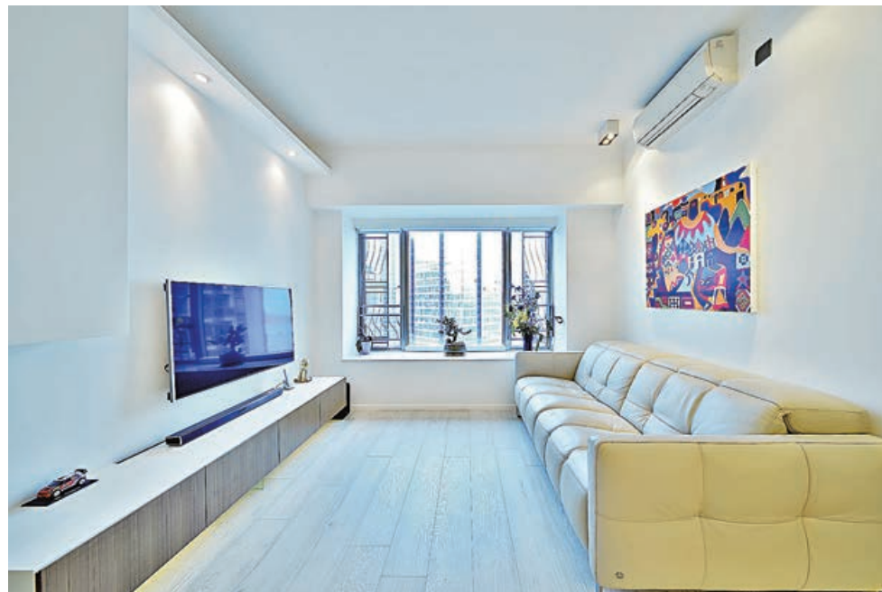
■長方形大客廳放置一張6座位梳化，可感受到空間之大。