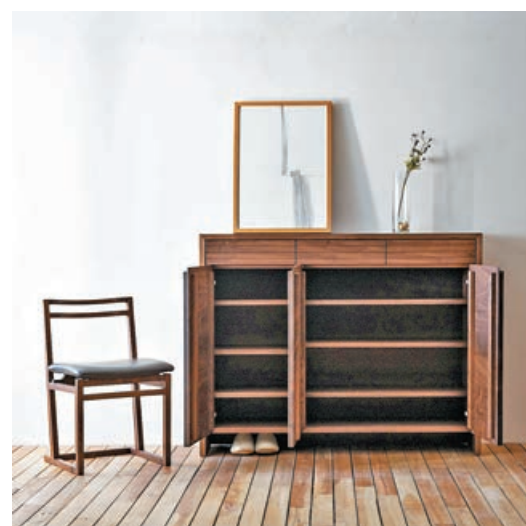
■實木鞋櫃最底一層特意做了鏤空的設計。