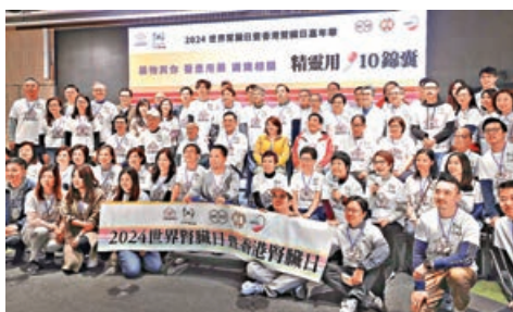
■活動冀教育病人正確用藥常識。

醫管局主席范鴻齡指出，目前醫管局每年藥物開支超過 96 億元，佔總開支 10%，其中專科門診每種藥收費 15 元，不限數量，長期以來造成很多藥物浪費的情況，未來將檢視整個藥物收費制度。