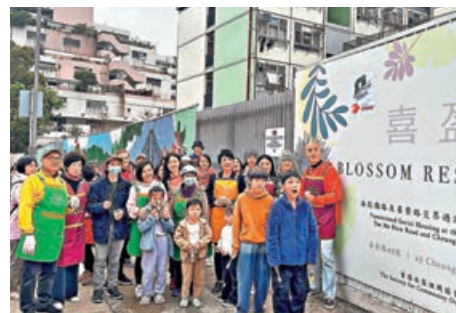
■「喜盈」住戶及義工一起大合照。