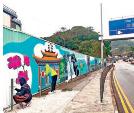
■義工在「喜盈」長達 80 米的外牆畫上荃灣及葵青區的特色景點。

社協副主任施麗珊表示，壁畫活動促進了基層社交，提升了過渡性房屋居民的幸福，她指「喜盈」早前接獲近 3,000 個申請，反應熱烈，第一批居民於去年 10 月入伙，第二批居民亦於今年 1 月入伙，目前入住率已爆滿。