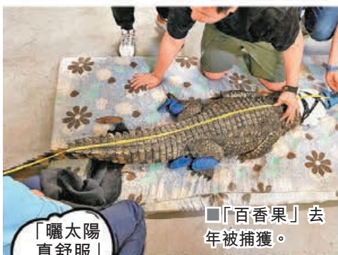
「百香果」去年被捕獲。