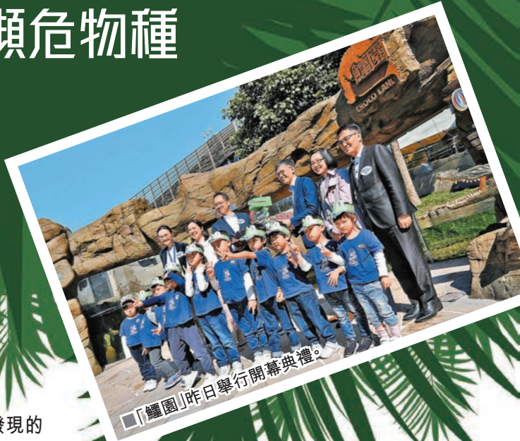
「鱷園」昨日舉行開幕典禮。