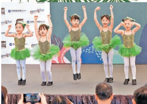
海洋公園安排小朋友表演，宣揚保育訊息。