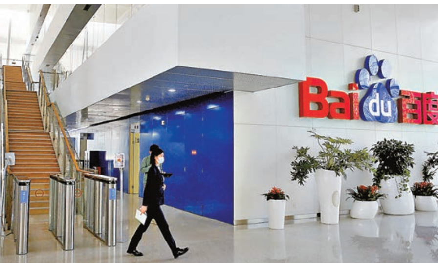
■ 百度四連升，惟走勢仍見落後。