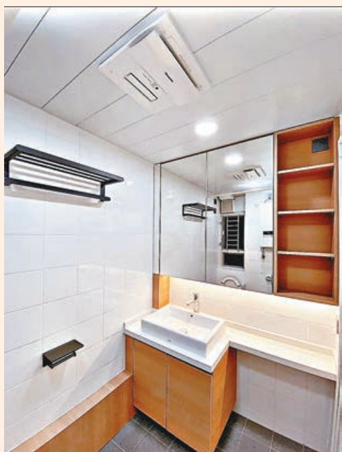
■ 廁所改動不大，僅裝設廁櫃。