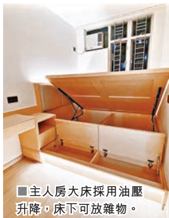
■ 主人房大床採用油壓升降，床下可放雜物。