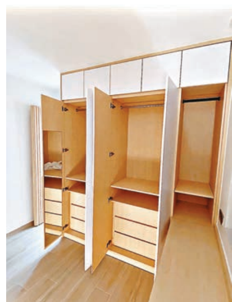
■ 衣櫃多櫃桶設計，可容納大量衣物。