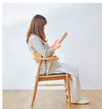
■ 椅子可以讓客人自由選擇座位的高度。

山上木工設計師希望透過現代人體工學的椅背及座面弧度，配合溫莎椅的幼身木框設計風格，製作出全新的 BOW Chair。向經典款式致敬之餘，同時創造出更舒服的椅子。