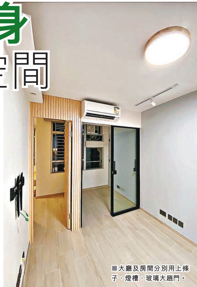
■ 大廳及房間分別用上條子、燈槽、玻璃大趟門。