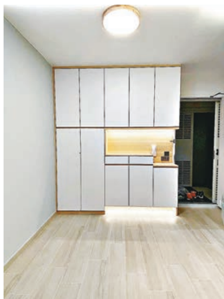
■ 大廳訂造的大型C字裝飾收納櫃。