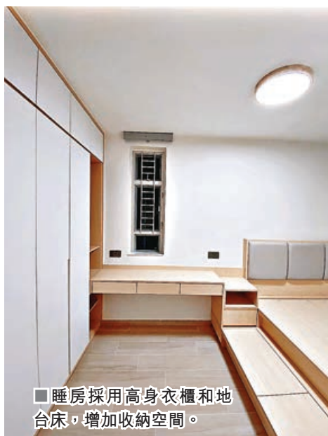
■ 睡房採用高身衣櫃和地台床，增加收納空間。