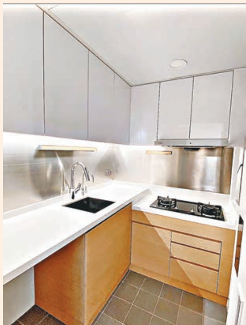
■ 廚房廚櫃採用白色和木色配搭。

他形容，由於公屋單位間隔所限，所以廚廁就沒大改動，只是做廚櫃、廁櫃。而獲派單位的戶主是一對較年輕的夫婦，他們對單位裝修的要求都會用上條子、燈槽、玻璃大趟門。因為用磚間了兩間房後，大廳就會比較黑暗，形成光線不足的黑廳。