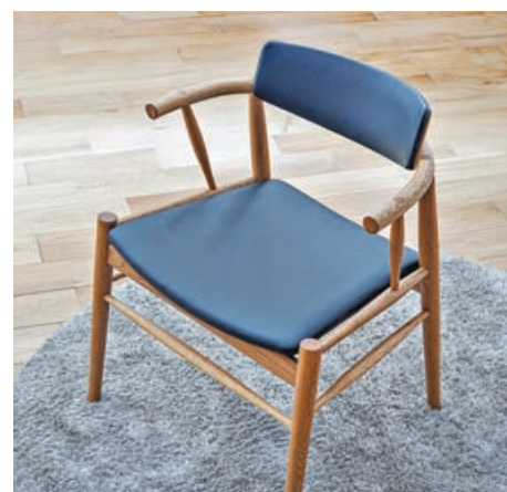
■ 椅子的入樁位，全部沿用原始的接木方式拼合。