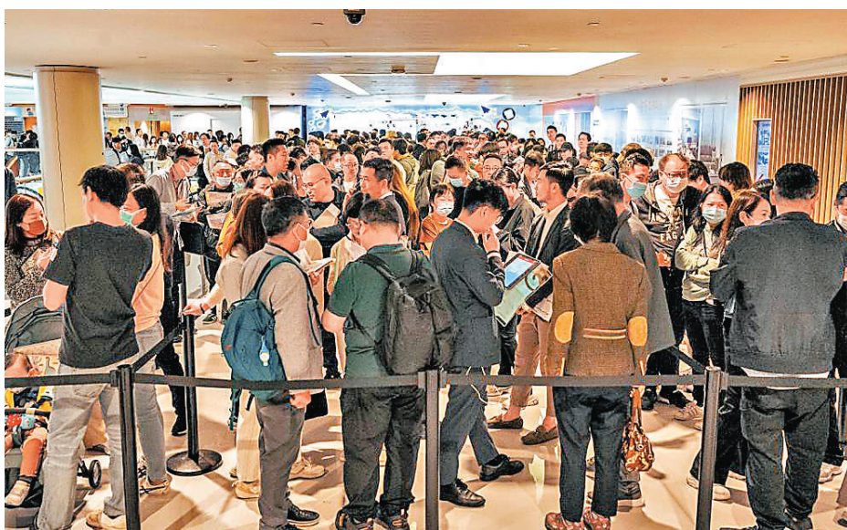
■泰峯售樓處人頭湧湧。

發展商趁市旺加快推盤步伐。其中，王新興集團發展的東九龍「泰峯」昨首日銷售，盡推第1A號及2號價單共336伙，另有12伙招標，共發售348伙。截至昨日傍晚6時，已沽出238伙，佔可售單位逾七成。分析料3月一手成交逾5,000宗，為1998年後按月新高。不過，新盤定價克制，搶去部分二手客源，剛過去周六日(16日及17日)，四大物業錄得十大屋苑交投稍為放慢，成交介乎15宗至25宗。