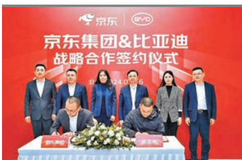
■京東集團與比亞迪日前在北京簽署戰略合作協議。

陳永傑預期，周末一手成交可達500宗，並突破撤辣後首周成交452宗紀錄，為7個月高位，預期3月份整體一手成交逾5,000宗，為1998年後按月新高。反映換樓鏈啟動。