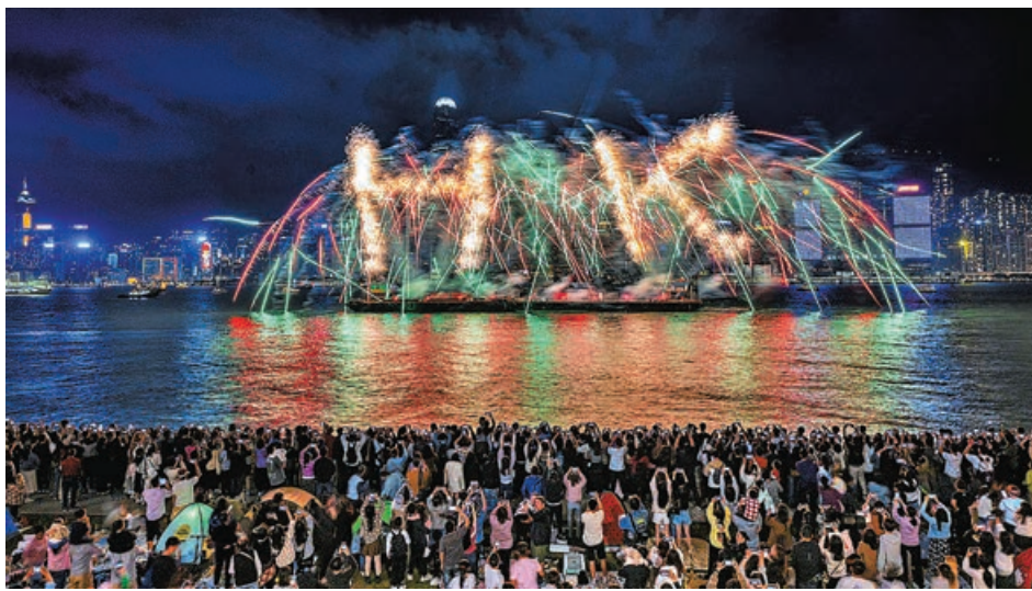
■ 旅發局將推每月主題煙火匯演。

香港在疫後恢復正常通關逾一年，旅遊業迅速復甦，今年首兩個月訪港旅客錄得780萬人次，相等於2018年同期的73%，預料今年全年訪港旅客達4,600萬人次，按年增加35%。旅發局今年將採取四大重點策略，包括舉辦和支持國際大型盛事，重頭戲是5月起，每月分別舉辦不同主題及設計的煙火和無人機表演，以配合當月節慶活動，預算每次煙火成本約100萬元，每次持續約10分鐘；旅發局並將於明年推出全新面貌的「幻彩詠香江」表演。