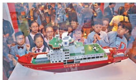
■ 亮點展品包括雪龍2號模型。

「雪龍2」號及其科研團隊完成南極考察任務後，下月8日將首次訪港，以香港作為回航返國的首個航站，屆時「雪龍2」號會停靠尖沙咀海運碼頭，讓市民有機會上船