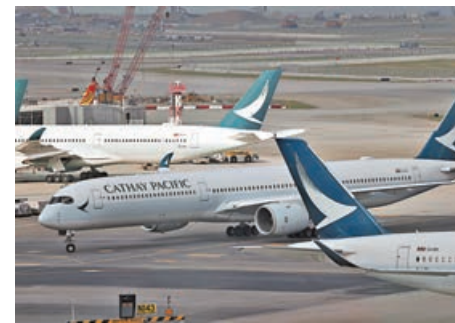
■ 國泰航空早前多次無預告下取消航班。

參觀創新的極地科研設備。有興趣上船參觀市民可透過「uutix」應用程式或瀏覽網頁版，於今日(19日)上午11時起登記，超額將抽籤決定。