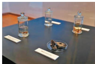
■ 會場展出在極地收集的生物標本。

參觀創新的極地科研設備。有興趣上船參觀市民可透過「uutix」應用程式或瀏覽網頁版，於今日(19日)上午11時起登記，超額將抽籤決定。