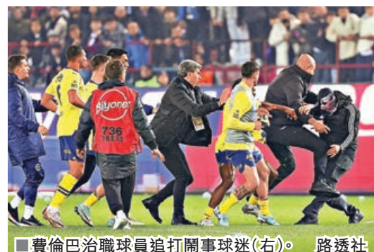
■費倫巴治職球員追打鬧事球迷(右)。

終在現場保安保護下，費倫巴治球員開始嘗試返回更衣室，避免引起更大麻煩。國際足協主席恩芬天奴事後表示：「無論係球場內外，所以暴力事件都唔可以接受，我哋必須保障球員安全，咁樣足球先可以帶畀球迷快樂。」同時，有土耳其政府官員亦表明會徹查事件。