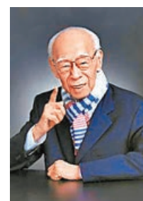
■饒宗頤學術成就非凡。

比賽由港大饒宗頤學術館、浸會大學饒宗頤國學院及城市大學專業進修學院合辦，今屆主題為「桑梓嶺南：饒宗頤與大灣區」，截止日期為8月10日。為配合比賽，港大饒宗頤學術館將於本月23日及下月6日首次免費開放予公眾參觀，展出多幅饒宗頤的墨寶、筆記本及書信真跡。