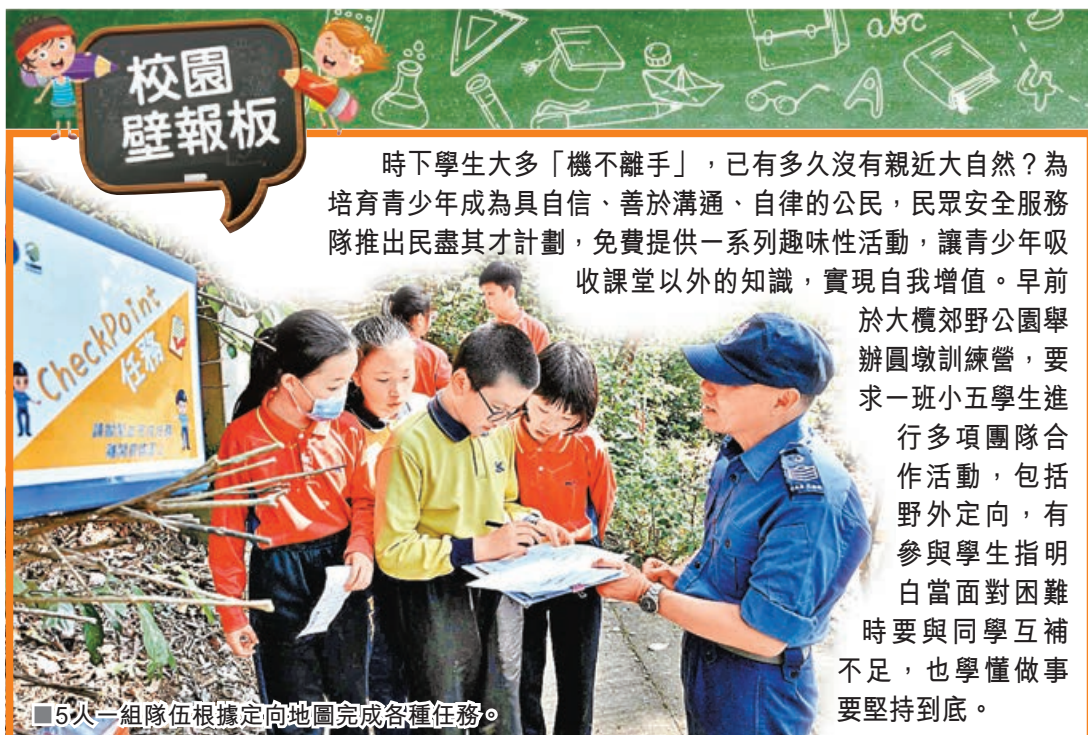
■5人一組隊伍根據定向地圖完成各種任務。

不是說車長跟乘客不能溝通，上車時大家當然可以說聲早安，但途中還是不要妨礙司機，雖然極少執法，但實際上違者也屬犯罪，為己為人，還是勿以身試法。