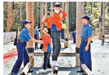
■全組須合力通過獨木橋、繩網陣任務，考驗團隊精神。

民安隊是次揀選了3個活動，希望提升參加者溝通、解難及抗逆能力，其中一項是野外定向需要5人一組，根據定向地圖指示尋找營地內各個關卡，並在導師指導下完成各種任務；另一項活動是低結構歷奇，參加者必須通力合作，全組一同通過如獨木橋、繩網陣才算完成任務，以考驗團隊精神；而最後的先鋒工程體驗，參加者要合力以竹和繩紮成羅馬炮架部件，進行競技遊戲。