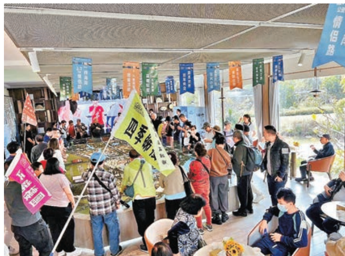
■睇樓團到大灣區新盤現場售樓處參觀示範單位。