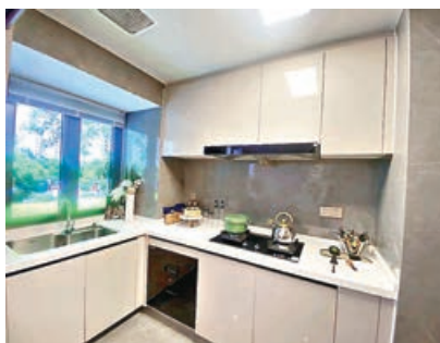
■廚房收納廚櫃齊備。