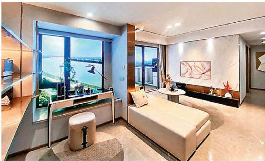
■客廳寬敞，小露台和窗台都可望無敵江景。