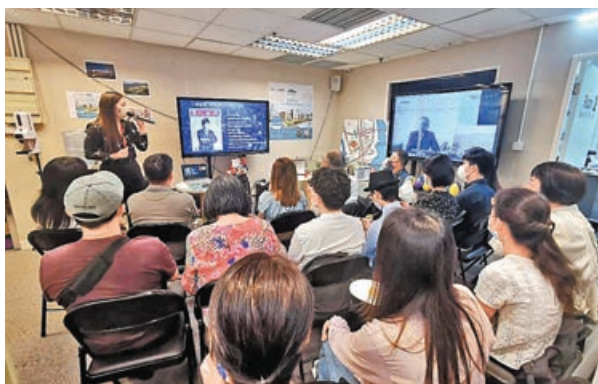
■四季海外環球置業香港展銷廳經常會舉辦大灣區置業講座。