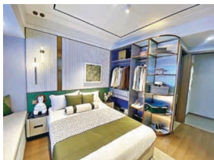
■主人房配設大型開放式衣櫃。