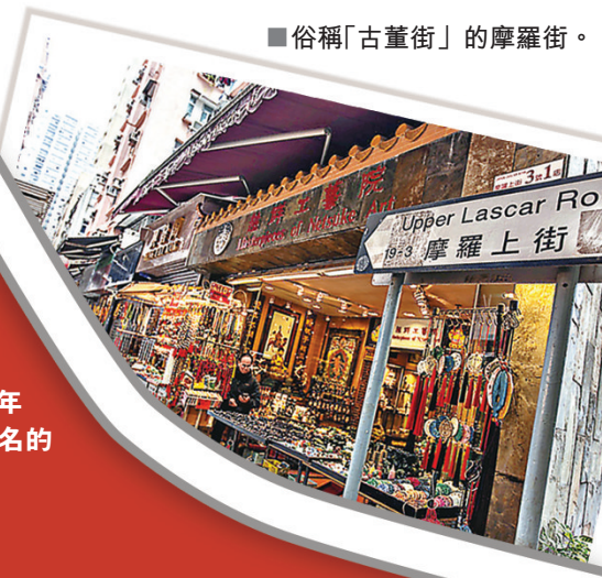
俗稱「古董街」的摩羅街。

很多人誤以為荷李活道一名來自美國電影夢工場荷里活，但事實絕非如此。荷李活道是香港開埠之後第一條完成興建的街道，當時附近一帶種植了許多冬青樹，而冬青樹的英名為 holly，由於繁茂成林，於是加上 woods，故此得名 Hollywood Road，音譯便成為荷李活道。荷李活道於 1841 年通車，比起在 1910 年代才成名的荷里活電影還要早數十年。