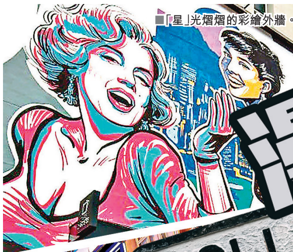
「星」光熠熠的彩繪外牆。