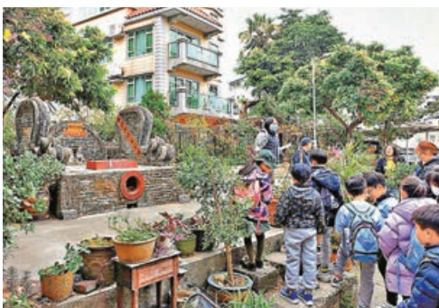
■小朋友們來屏山文物徑遊學。

鄧氏宗祠是屏山鄧族的祖祠，也是文物徑上的代表性建築，建築屋脊上飾有石灣陶塑鯨魚和獅子，後進祖廳則供奉鄧族先祖的神位。於1870年落成的觀廷書室坐落於坑尾村，兼具教育及祭祀祖先的作用。書室對面是一家名為屏山跑車餐廳的主題西餐廳。