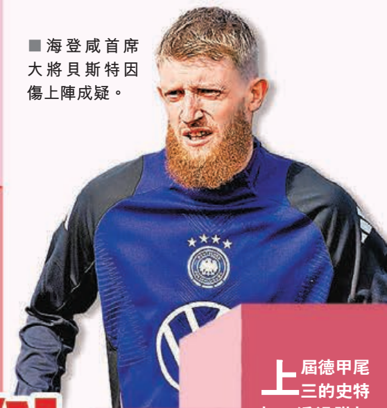
海登咸首席大將貝斯特因傷上陣成疑。