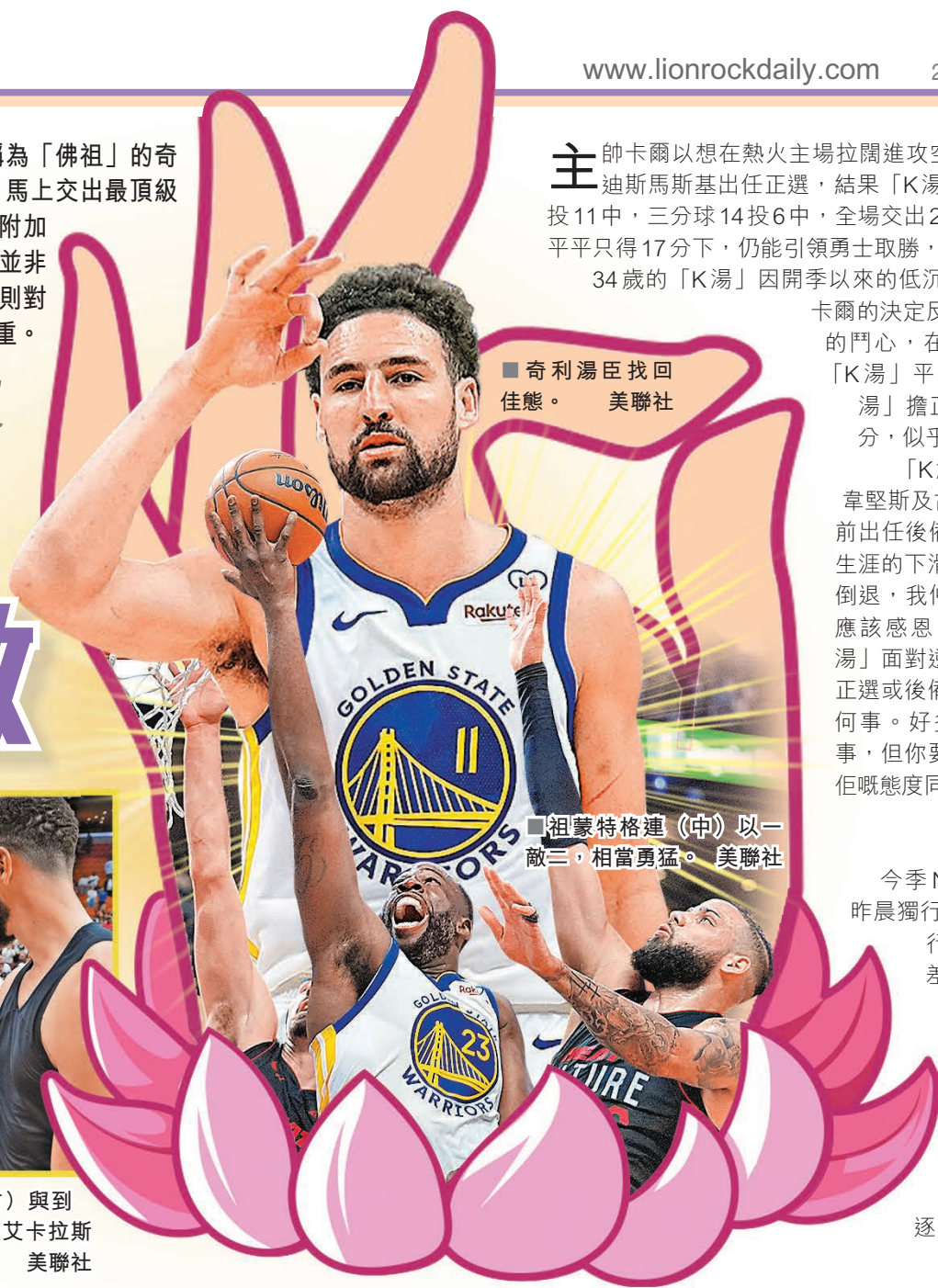
■奇利湯臣找回佳態。