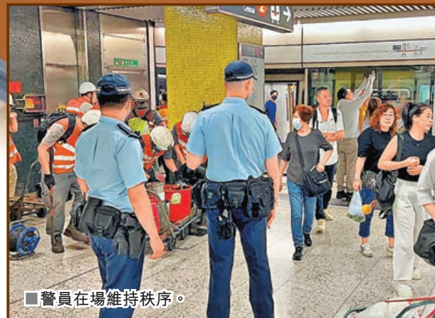
警員在場維持秩序。

昨日上午約8時，港鐵工程人員發現荃灣線尖沙咀站附近有路軌出現裂縫，為確保行車安全及減少對市民出行的影響，港鐵隨即安排工程人員搶修，利用臨時加固組件