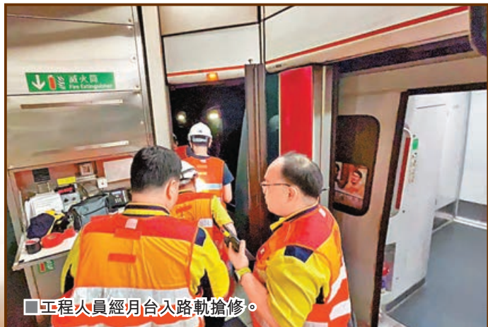
工程人員經月台入路軌搶修。

港鐵荃灣線尖沙咀站附近一段路軌昨晨發現裂縫，為確保行車安全，工程人員須即時採取臨時加固措施，列車全日駛經該處均需慢駛，來往中環站及荃灣站的整體行車時間需額外3至5分鐘，幸昨日是公眾假期，沿線車站候車乘客不算多，影響不大。港鐵於今日凌晨收車後更換有關路軌及調查裂縫原因，預計不會影響市民返工返學。曾任職港鐵的立法會議員張欣宇認為，今次路軌裂縫或已貫穿路軌，但並不罕見，港鐵採取快速應對方案提高行車安全系數，不至於要完全停駛。