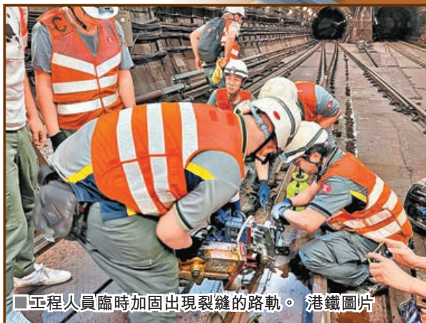
工程人員臨時加固出現裂縫的路軌。