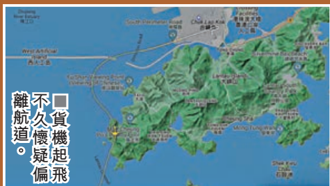
貨機起飛不久懷疑偏離航道。

根據飛行紀錄網站Flightradar24，編號QR8421的波音777貨機，昨日約2時半在赤鱗角機場向珠江口方向起飛後，懷疑偏離航道，一度轉向南面，靠近二澳及分流一帶的上空，當時飛行高度約1,500米。