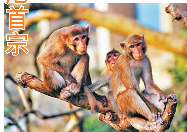
■本港多個郊野公園常有獼猴出沒。

感染及傳染病醫學學會會長林緯遜指出，人類感染猴疱疹病毒情況罕見，病毒傳播至人類，有機會進入人體中樞神經系統，對腦部及脊椎神經造成相當大破壞，不經治療死亡率可高達80%。