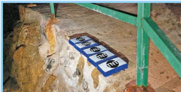
■寫有「TNT」的小型包裹離奇出現春坎角泳灘。

押至元朗宏業西街一工廈迷你倉，再搜出約3公斤懷疑可卡因磚。13公斤可卡因磚總值約1,300萬元，梁姓男子被暫控3項販毒罪，今於屯門裁判法院提堂。