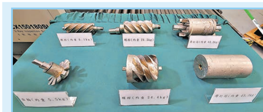
■ 不法分子將黃金鑄造成空氣壓縮機零件。

關員用X光掃描器檢查下，顯示兩台機器內某部分位置的密度相當高，於是拆開機器作深入檢查。其中藍色壓縮機內部組件結構複雜，包括有摩打、泵及分離器等。摩打軸芯被線圈包圍，線圈則被膠紙散亂綁紮，拆開扣住摩打的齒輪，再發現軸芯金屬兩側有不尋常膠水跡，用鐵錘輕敲中間組件檢查，即出現明顯凹痕。關員嘗試刮去金屬上鋼色油漆，即發現內層金屬物料呈金色，遂