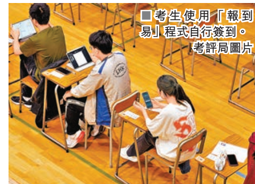
■考生使用「報到場」程式自行簽到。

點考場舉行的首科考試順利完成，各考場均有最少兩名考評局職員、由香港委派的試場主任和監考員，以及原校與外校監考員負責各項考務安排。考務人員於開考前從設於校內的「保密室」取出存放試卷的保密箱，再由考評局發出的保密箱開啟密碼取出試卷，確保內地考場與本地考場在相若時間取得試卷，再按考評局既定程序分發和準備考試。另外，位於香港的考評局指揮中心全程監察試點考場情況，並與兩考場保持聯繫。