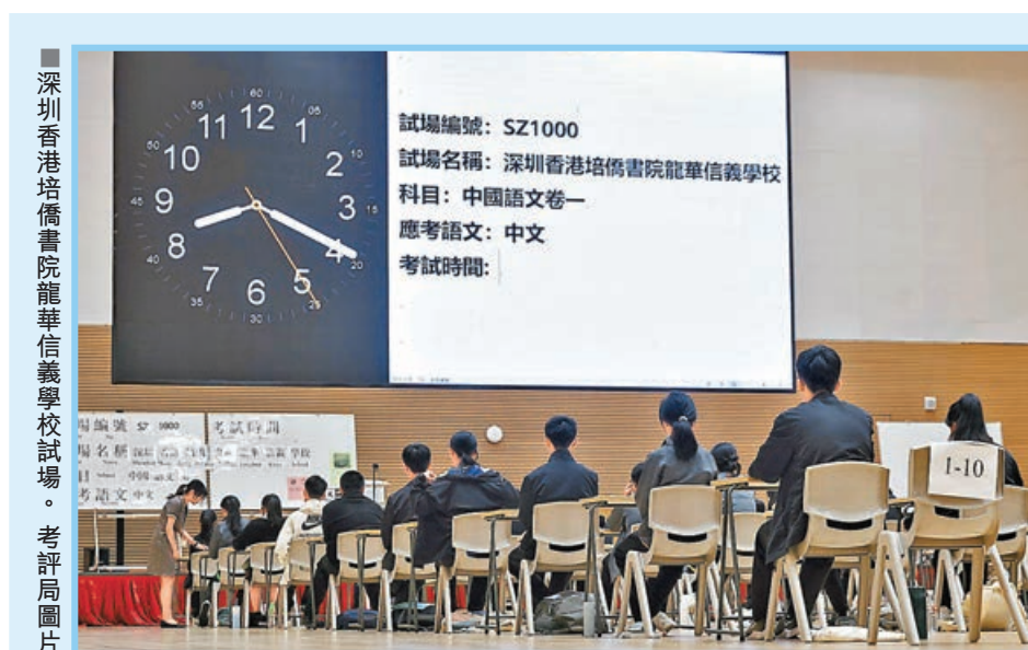
■深圳香港培僑書院龍華信義學校試場。