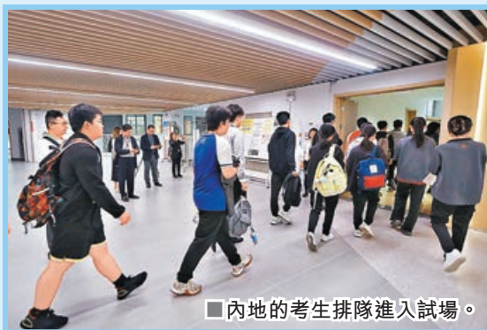
■內地的考生排隊進入試場。