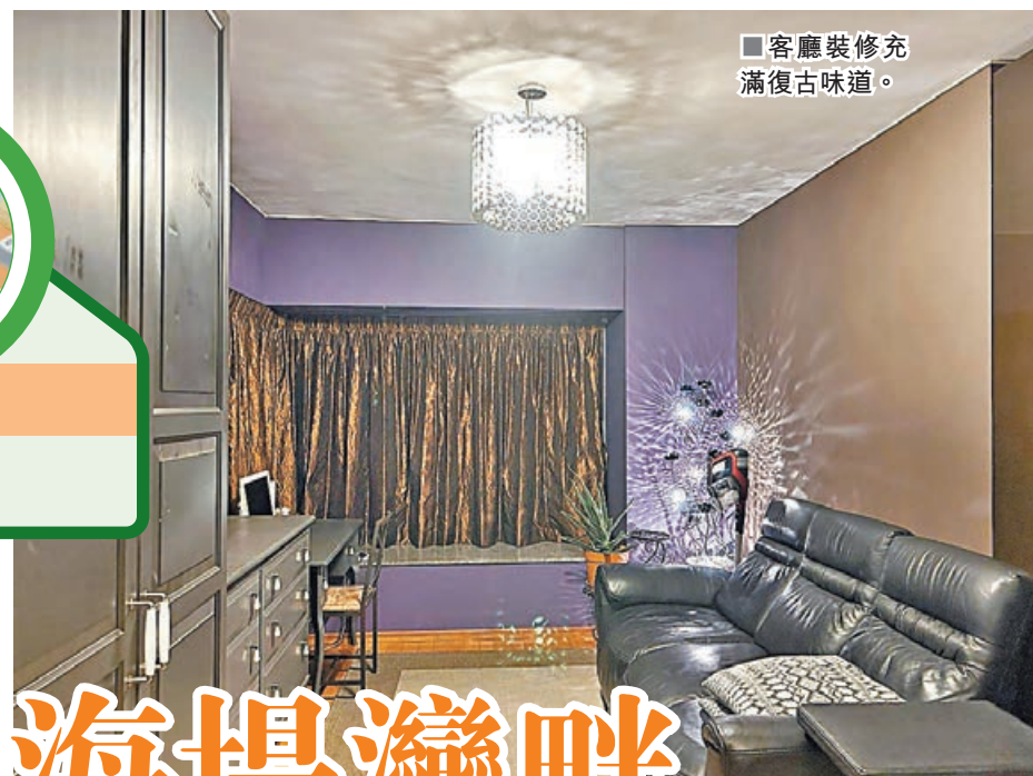
■客廳裝修充滿復古味道。