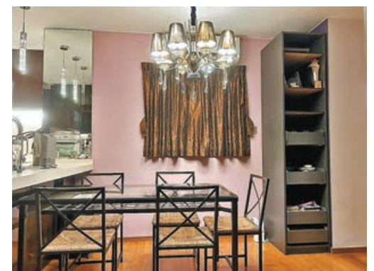
■飯廳一角配搭水晶吊燈。