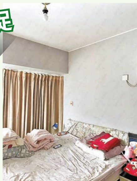
■睡房採用舊式窗台設計。