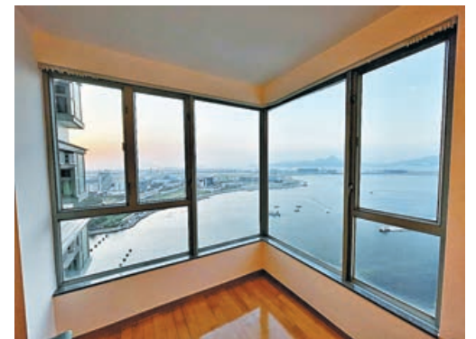
■房間可望無敵海景。