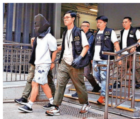
保險經紀疑打劫找換店被捕。

華豐大廈一間賓館的女職員則表示，賓館共有十多個房間，但受火警影響無法營業，須向顧客退款，「每一單都有二三百元」，現難以估計損失。她又強調對死傷者一定要有交代。