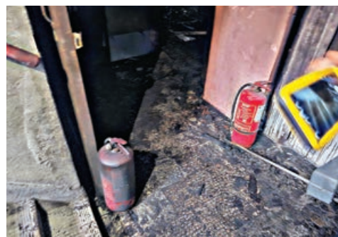
大廈內發現多個過期滅火筒。

記者昨在現場所見，當日火勢最猛烈的一樓及二樓，幾乎所有東西都被燒毀，其中位於一樓的「勁力健美中心」，牆