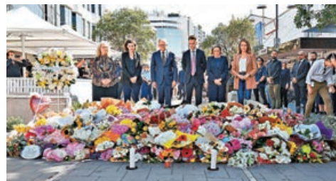
■澳洲總理阿爾巴內塞（左三）與多名高官，到案發商場外獻花悼念斬人案死者。

者古德，是案件中受傷的9個月大女嬰的母親。事發時古德為保護女兒身中多刀，之後強忍傷痛，將女嬰交給兩名男性途人，懇求他們將女兒帶到安全地方。古德最終傷重不治，她的女兒已接受手術，現時在深切治療部留醫，情況穩定。