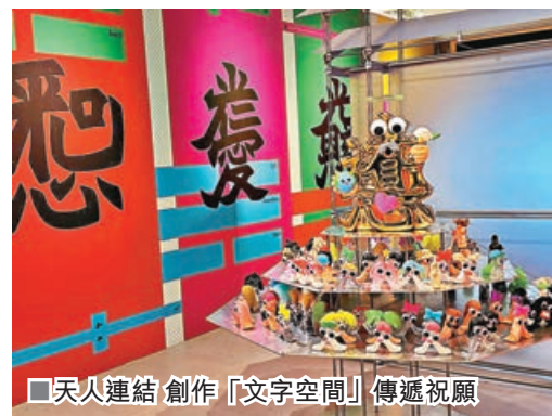
■天人連結 創作「文字空間」傳遞祝願