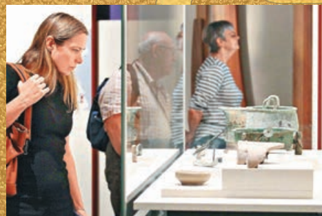
■展覽吸引不少觀眾入場參觀。

「天地之中—河南夏商周三代文明展」亮相香港歷史博物館。河南位處黃河中下游，從史前時期，歷經夏商周、漢唐以至北宋，是歷史上重要的政治、經濟和文化中心。中國歷史記載中最早的三個朝代——夏商周均於河南建都，留下豐富的歷史文化遺產。本次展覽是香港歷史博物館和香港弘揚中華文化辦公室協作的「中國通史系列」首個展覽，展出250餘件（套）河南省出土的青銅器、玉器和陶器、甲骨等，其中33件（套）為國家一級文物，40件（套）為首次離開河南省進行展覽。展覽即日起至7月8日向公眾免費開放，市民通過展覽以文物為點、以朝代為經、以時間為緯，順着歷史軸線溯源而上，回到夏商周時期的中原地區，了解河南省重要的城址遺蹟、以及夏商周三代的政治、社會、禮制和文化面貌，增進對國家歷史研究工程——中華文明的認識。