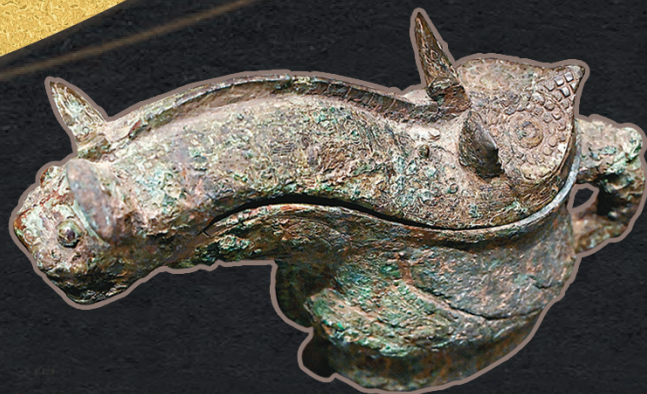
■河南博物院的藏品—商代後期的「婦好」圈足觥，出土於安陽殷墟婦好墓。