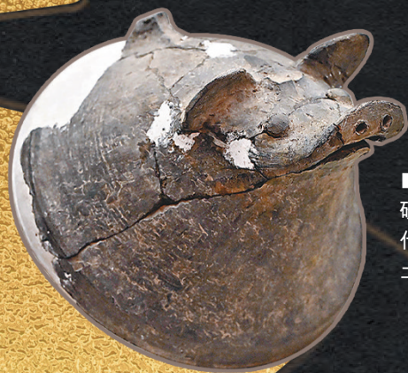
■鄭州市文物考古研究院的藏品—夏代的陶豬頭蓋，出土於新密新砦寨。