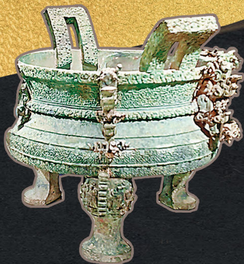
■「王子午」鼎是為王子午所製造，特殊之處是鼎蓋及鼎身內皆有銘文。