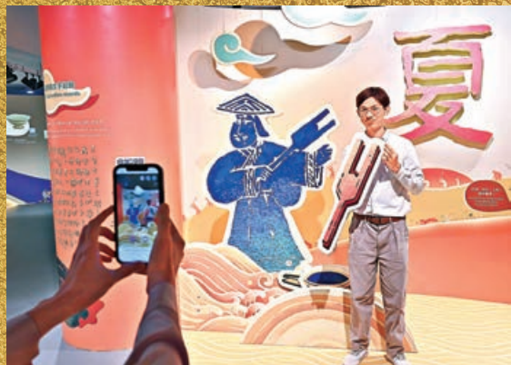
■展覽設有教育互動區，透過趣味展示、互動遊戲及動畫，讓參觀者認識和了解璀璨的三代文明及其與現今生活的關連。