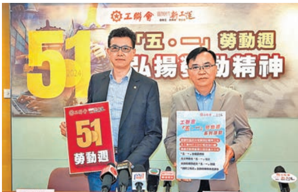
工聯會昨日舉行記者會。

工聯會今年提出的「五一倡議」，主要內容包括：配合八大中心發展，制訂人力資源規劃加強職業教育與培訓；監督輸入外勞和人才計劃；確保本地就業優先；加強新就業形態保障，完善三方協商機制；遏止嚴重工業意外，改善職業安全健康等。