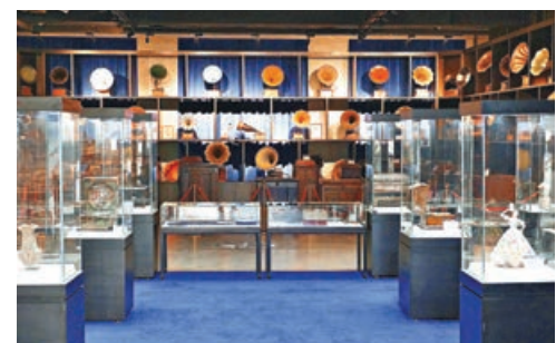
■世界音樂文化博物館收藏的留聲機。

除了能在水城享受文化之旅，隨着天氣轉暖，炫彩奪目的東港音樂噴泉也即將開啟，市民遊客均可免費觀賞。花樣繁多的噴泉伴隨五彩燈光和動感音樂，每場半小時的表演總會讓遊客流連忘返。