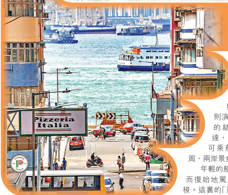
■香港堅尼地城爹核士街風光與大連港東五街有異曲同工之妙。

泛舟。日暮時分，伴隨樂隊的悠揚旋律，眾多遊客在「東方水城」的威尼斯風情運河邊開懷暢飲。未覺盡興者，乘「貢多拉」泛舟河上，沉醉於沿岸美景。