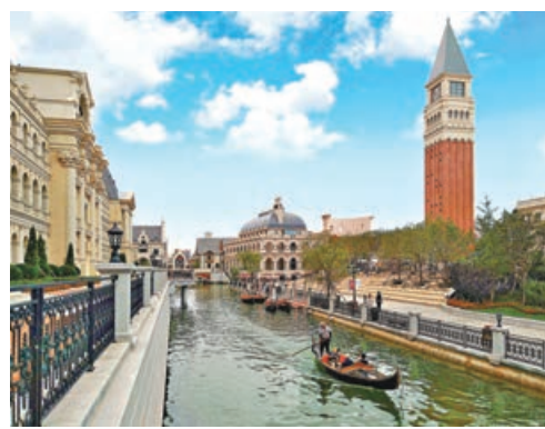
■遊客在東方水城乘坐「貢多拉」觀賞兩岸風光。

港東五街自帶南高北低的坡度，因視覺原因，站在高處遠眺，盡頭直通蔚藍大海。原本數百米的街道、寬廣的場景，在長焦鏡頭下會變得緊湊而富有張力。船隻從海面駛過，輔以熱鬧的街景、無人駕駛公交車以及湛藍天空，構成了一幅天然、唯美的浪漫畫卷。