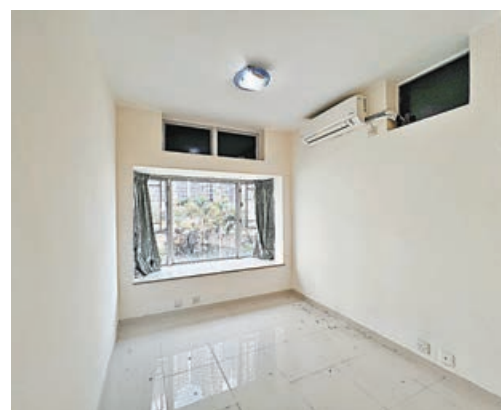
■房間設有大窗台，光線充足。