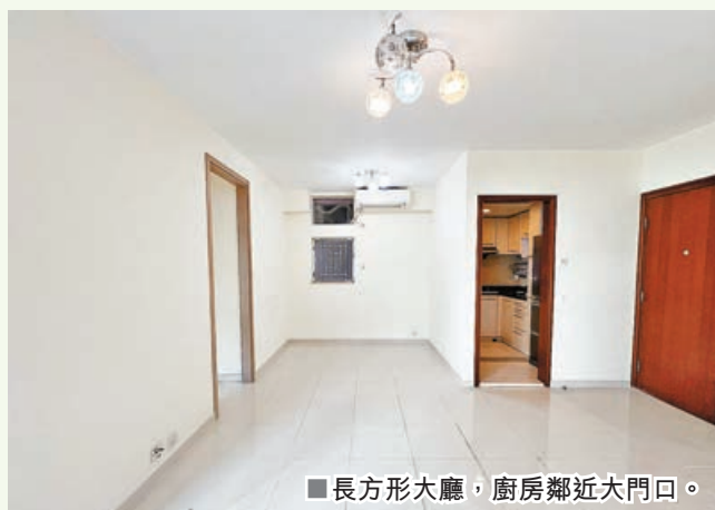
■長方形大廳，廚房鄰近大門口。

是次放租單位為1期2座低層E室，實用率逾八成，單位為三房套間隔，現時屋苑最新共有7個放租盤，租金由16,000元至23,000元不等。租客以區內分支家庭為主，亦包括外區家庭客。