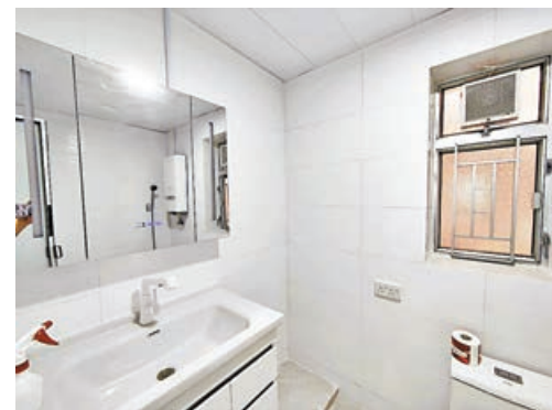
■廁所設有大型洗面盆及廁櫃。