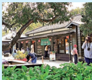
■ 檜意森活村吸引不少遊客參觀。