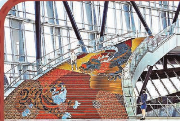
■ 故宮博物院南院內景。