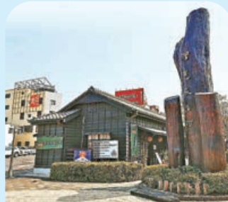
■ 檜意森活村主要建材為紅檜以及福州杉。

檜意森活村內村鋪眾多，分為文創市集、生活創藝、在地有禮、好飲好食及時光特區，如奇木館、並木館、祈福館及所長官舍等。若想更進一步了解檜木之美，不妨到奇木館走一趟奇木風景。店中有陳列各種聞香瓶，也有以檜木精油製成的提神滾珠瓶或按摩霜，既紓壓，又能沉浸在檜木香氣中。