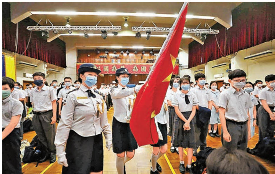
■有中學生上課前舉行升國旗典禮。