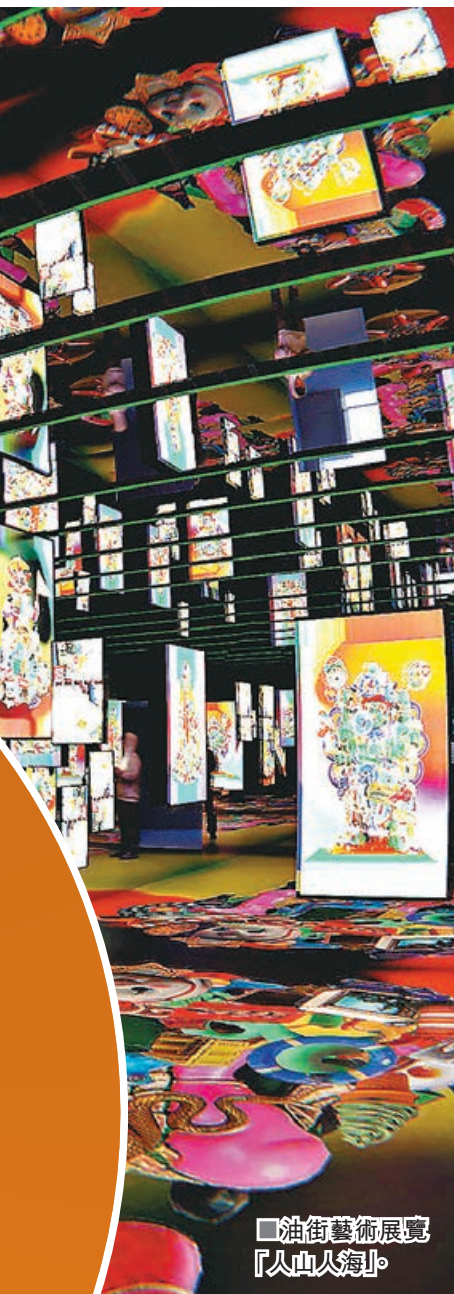
■ 油街藝術展覽「人山人海」。