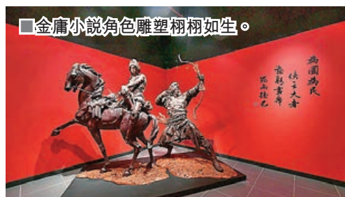
■ 金庸小說角色雕塑栩栩如生。