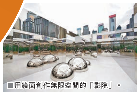
■ 用鏡面創作無限空間的「影院」。