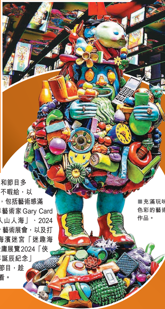
■ 充滿玩味色彩的藝術作品。

本港五月活動和節目多 羅羅，各種展覽目不暇給，以 下搜羅五月好去處，包括藝術感滿 滿的倫敦著名跨界藝術家 Gary Card 首場個人展覽「人山人海」、2024 Affordable Art Fair 藝術展會，以及打 卡度滿分的灣仔海濱迷宮「迷趣海 濱」2024，還有金庸展覽2024「俠 之大者：金庸百年誕辰紀念」 等，停不了的豐富節目，趁 「五一」假有空看看。