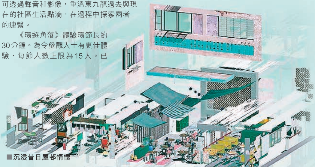
■ 沉浸昔日屋邨情懷

地點：東九文化中心展廊 日期：即日起至7月30日 時間：12:00—21:30 (最後一場21:00) 費用：免費入場