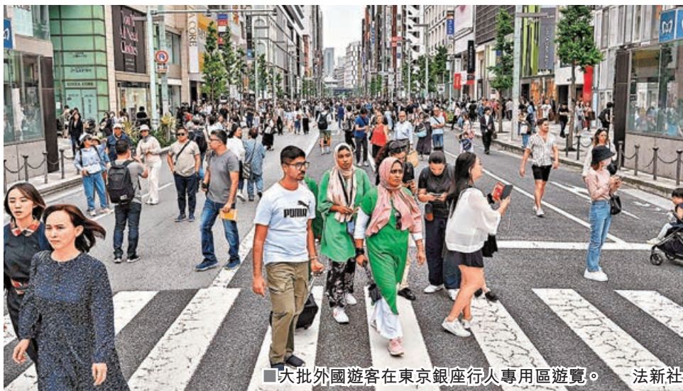
■大批外國遊客在東京銀座行人專用區遊覽。

日本從1964年因應東京奧運開放出境旅遊自由化，至今已有60年。多年以來，日本旅行社多將出境旅遊作為業績支柱。伴隨日本積累巨額貿易順差，為避免出現嚴重貿易摩擦，日本政府亦鼓勵推動出境旅遊、增加貿易逆差作為平衡。為實現這一目標，日本政府甚至積極資助其他國家開發旅遊景點，幫助他國吸引日本遊客。經過多年積累，到疫情前的2019年，