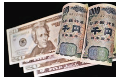
■日圓疲弱，令日人外遊精打細算。

日圓貶值吸引大批海外遊客湧入「血拚」，日本遊客想要出國則需精打細算。統計顯示今年前三個月，赴日海外遊客人均支出按年激增52%，不少海外遊客得益日圓貶值，在日本大掃平貨。