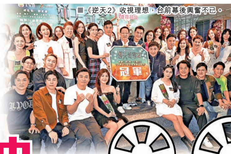
■《逆天2》收視理想，台前幕後興奮不已。