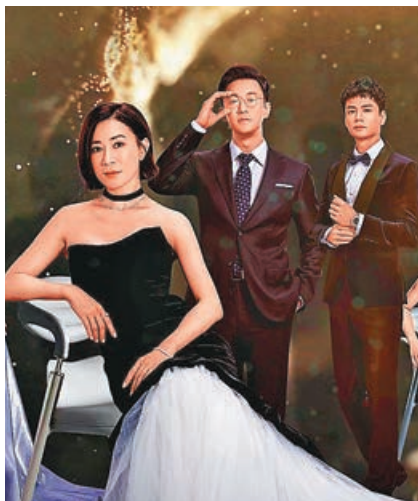
■羅嘉良化上老妝，依然有型。