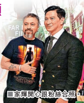
■家輝開心跟粉絲合照。

張家輝執導及主演新作《贖夢》獲邀參加意大利烏甸尼遠東電影節競賽單元，並於前晚舉行世界首映。家輝抵達大劇院時，獲影迷夾道歡迎，當中不少是內地影迷專程赴烏甸尼支持，他即場跟影迷交流及合照。放映完畢，觀眾拍掌長達兩分鐘，家輝感動得起身雙手合十，向全場觀眾鞠躬致謝。他笑言帶著《贖夢》來到意大利希望有好意頭：「我作為導演帶住《贖夢》嚟到意大利，進行一個世界性嘅首映，個意思咪就係大利囉，因為意大利嘛，希望大家睇得開心。」