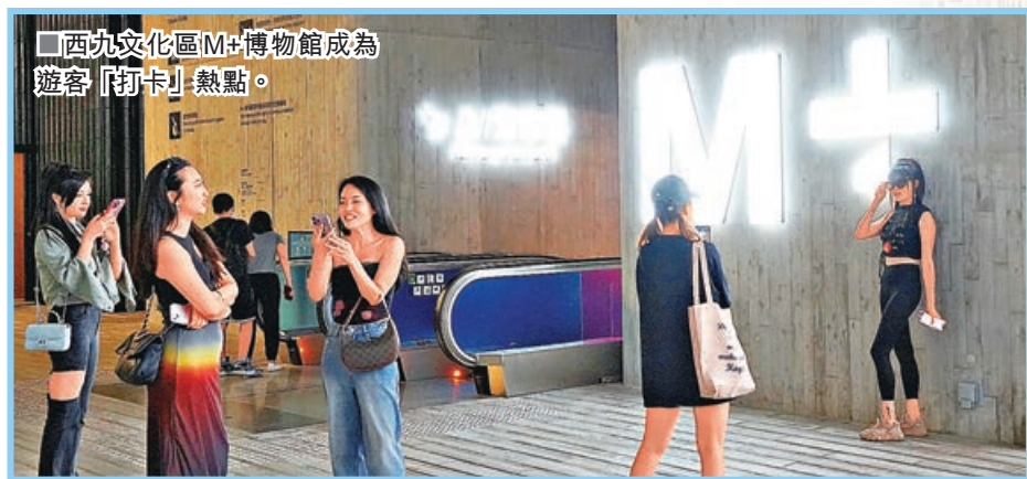
■西九文化區M+博物館成為遊客「打卡」熱點。

五一黃金周期間，數以十萬計的內地旅客入境本港旅遊。儘管近日香港春雨不斷，惟不減這些旅客的熱情，無論是著名觀光景點，還是大街小巷，甚至郊野公園，都可以看到眾多內地旅客的身影。本報記者昨在街頭隨機訪問時發現，許多旅客都是初次來港，他們或是獨自前來，或是帶同情侶或家人，都表示是受香港的人文、環境所吸引，稱讚香港值得一來再來，也是深度遊的好地方。